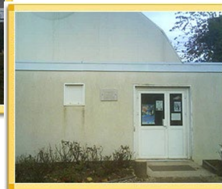
Gymnase André Violette Situé au fond du stade de football